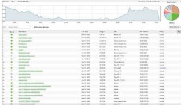
USER ANALYTICS AND TRAFFIC SHAPING