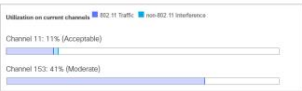
LIVE TROUBLESHOOTING TOOLS